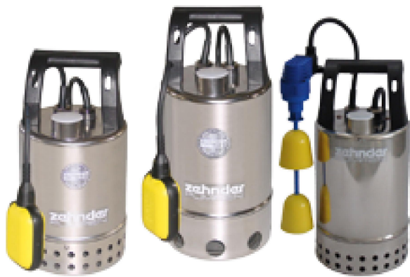
E-ZW 50 A-2